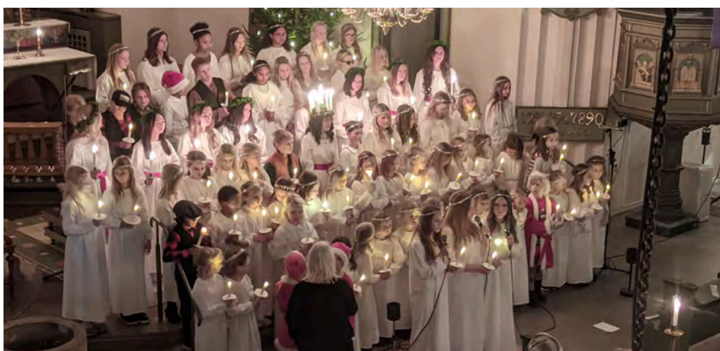
Välbesökta Luciafirandet den 13 dec i Gränna kyrka