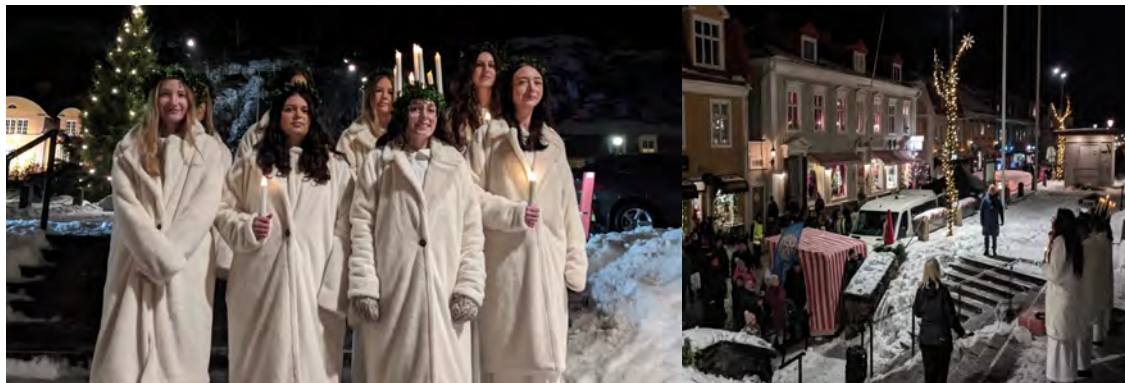
Luciakröningen på Julmarknaden den 10 dec.