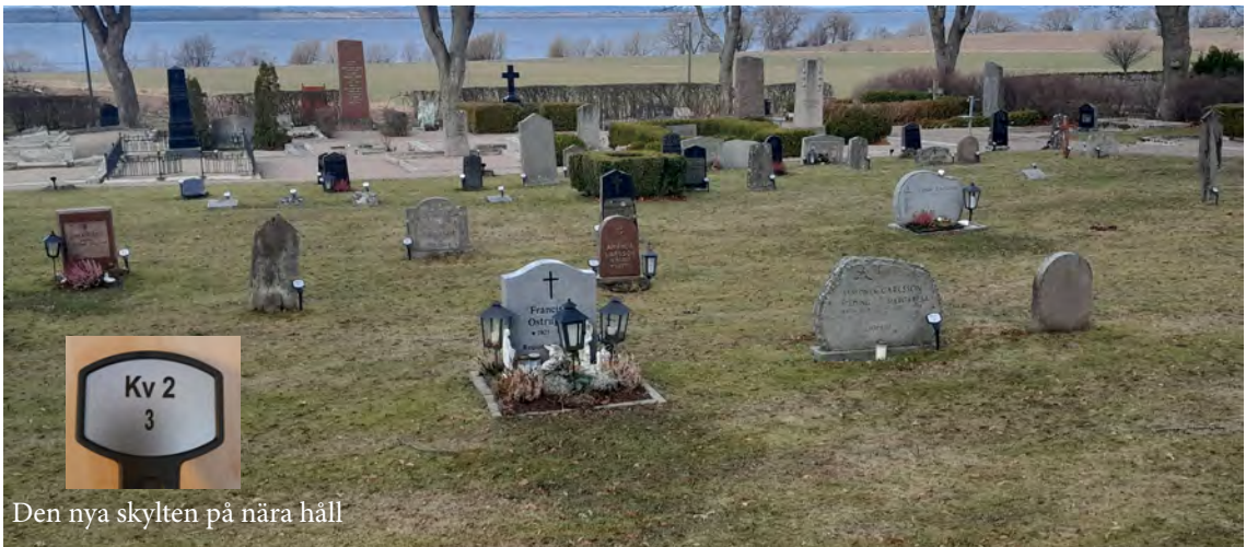
Den nya skylten på nära håll