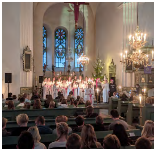
Luciafirandet den 13 dec i Gränna kyrka