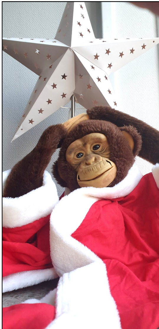
Egentligen ville fotografen att jag skulle posera med tomteluva så här inför jul. Men det är för varmt!!!

I November!! Att det var något rekord för Gotland. Att det aldrig varit sommar så här länge. I alla fall om man tittar på en termometer. Så om jag fattat rätt så räknas det som höst när det varit under 10 grader i 5 dygn. Och sen för att det ska bli vinter så ska det vara under 0 grader i 5 dygn. Men det har vi inte haft så då räknas det som sommar.