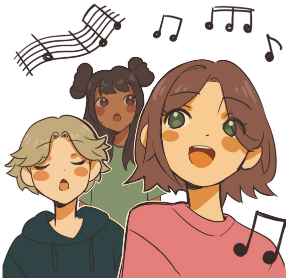
Illustration: Dorothea Malmros