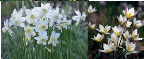
Lökar för vandr- ande skugga