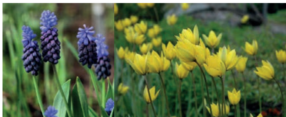
Lökar för sol

Varje perennpaket kompletteras med lökväxter efter ståndort och planteras på hösten första året.