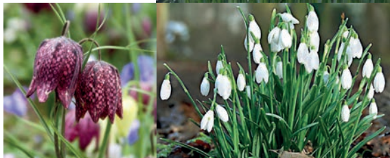
Lökar för skugga