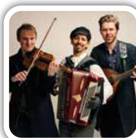
Grabbarna från Eken