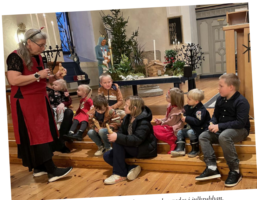
Vid krubbgudstjänsten var barnen med när figurerna placerades i julkrubban.