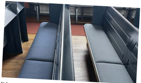
Efter mer än 30 år har bänkarna i Traryds kyrka fått ny klädsel (bänken till vänster).