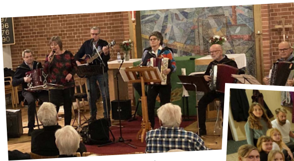
Kronobågarna stod för ett uppskattat inslag på Öppet hus.