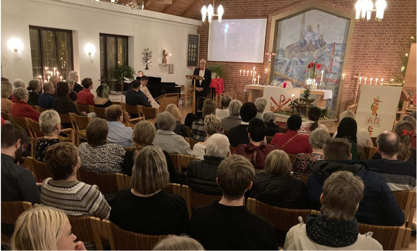
Julnattsmässan fyllde S:t Andreas kyrka.