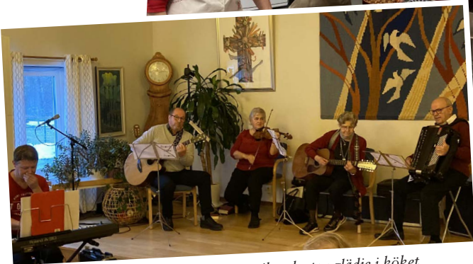
Besökstjänstens julfest med härlig musik och stor glädje i köket.