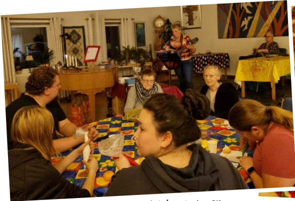
God gemenskap med pyssel vid Adventsstugan.