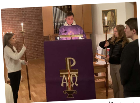
Evangelieprocessionen markerar att läsningen av Evangeliet är en av höjdpunkterna i mässan.