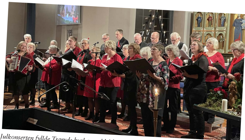
Julkonserterna fyllde Traryds kyrka med både människor och ljulig musik.