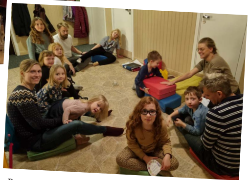
Barnverksamheten lockar deltagare från både när och fjärran till gemenskap, undervisning och fika.