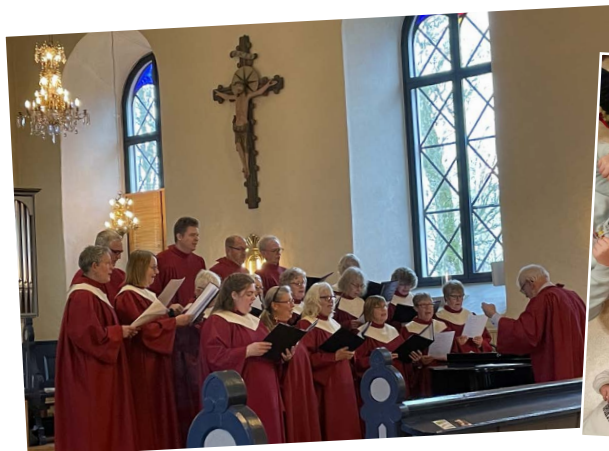
Dotter Sion, se din Konung - på krucifixet!