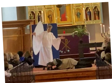
Vid julspelet för skolbarnen i Traryd och Strömsnäsbruk kom en ängel för att väcka Josef.