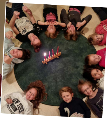
HimlaBUS och Juniorerna samlade till andakt i Advent.