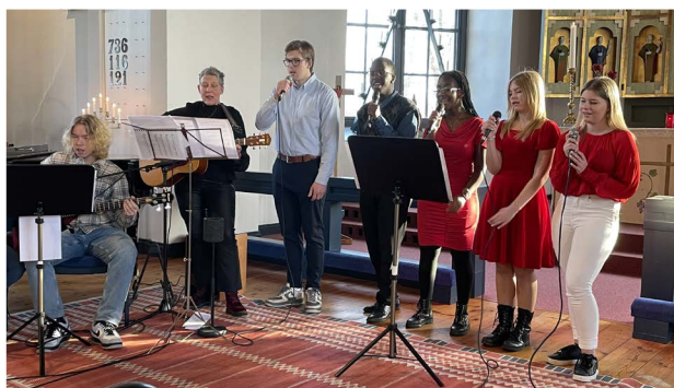
Vid julbönen fick vi höra vacker sång och musik.