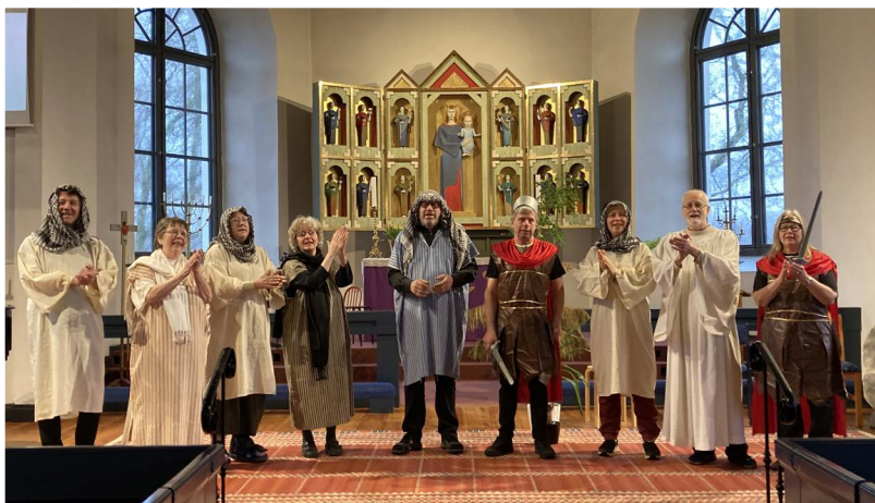
Påskspelet för våra skolor avslutades med jubelsång av hela ensemblen.