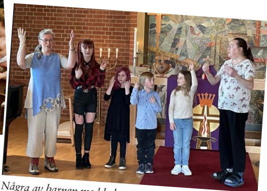
Några av barnen med ledare medverkade i S:t Andreas.