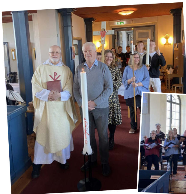
Påskdagen: redo för festlig procession!