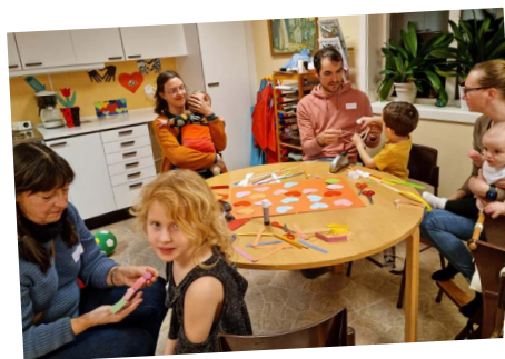
Flitig aktivitet i Himmeryds församlingshem inför Messy Church.