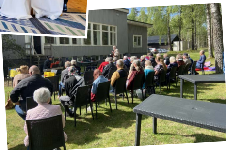
Det blev en välbesökt och fin torggudstjänst i Hinneryd på Kristi himmelsfärdsdag.