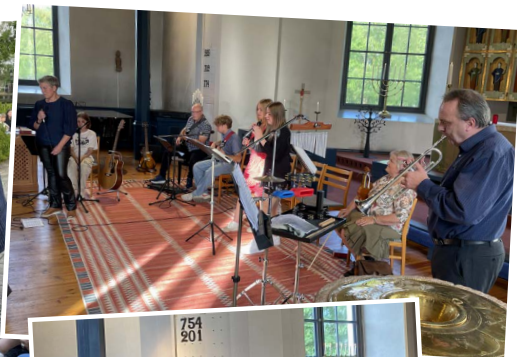
Vid två tillfällen bjöds det in till "Musik i sommarkväll" i Traryds kyrka. Det blev uppskattade konserter, som samlade många i kyrkan och till den efterföljande korvgrillen.