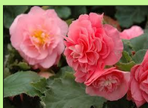
Begonia Non Stop