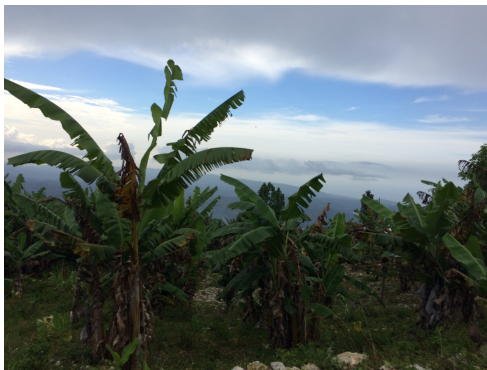
En av Haitis nationalparker.