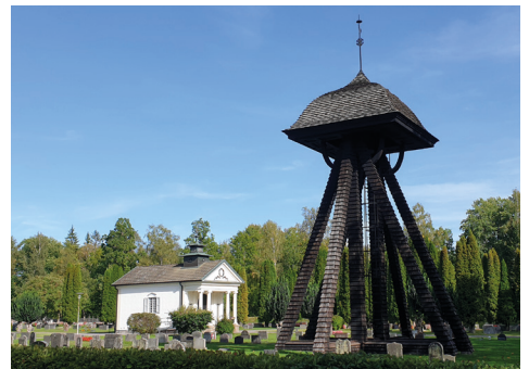
Klockstapeln på Lessebo begravningsplats

Klockstapeln i Lessebo ska tjäras om under hösten. Sockenstugan i Ljuder håller på att målas om utvändigt.