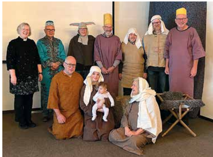
Samarbete med julspel för barnen. Personal och ideella från Svenska kyrkan i Fristad och Equmeniakyrkan i Fristad.

Ett skäl till samarbete som blir allt viktigare tänker jag är vad man kanske kan kalla strategiska skäl. Till exempel i relation till skola och samhälle. Jakob Forssmed, socialminister, uttryckte nyligen att det ibland finns en "religiös analfabetism" i kommuner och hos offentlig förvaltning. Religion ses som riskfaktor, kyrkor som extremister. Kanske är det han beskriver något tillspetsat och kanske är det