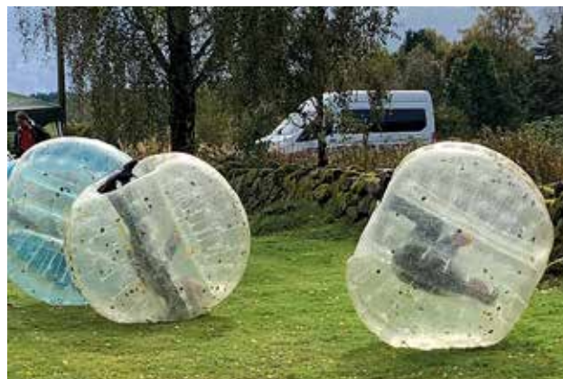
"Bubbelboll" - en populär aktivitet under Världens Barn-dagen.

Lördagen den 28 september anordnades en dag för Världens Barn vid prästgården, i samarbete med flera aktörer och idella. Många kom och bidrog samtidigt som de hade roligt ihop. Tack till alla som bidragit på olika sätt till insamlingen. Tillsammans samlade vi in drygt 37 000:- till fattiga barn i såväl Sverige som resten av världen.