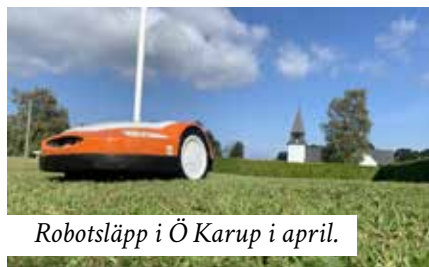
Robotsläpp i Ö Karup i april.

I övrigt så är vår ambition som alltid att våra kyrkogårdar och begravningsplats ska vara vackra och till glädje för alla våra besökare.