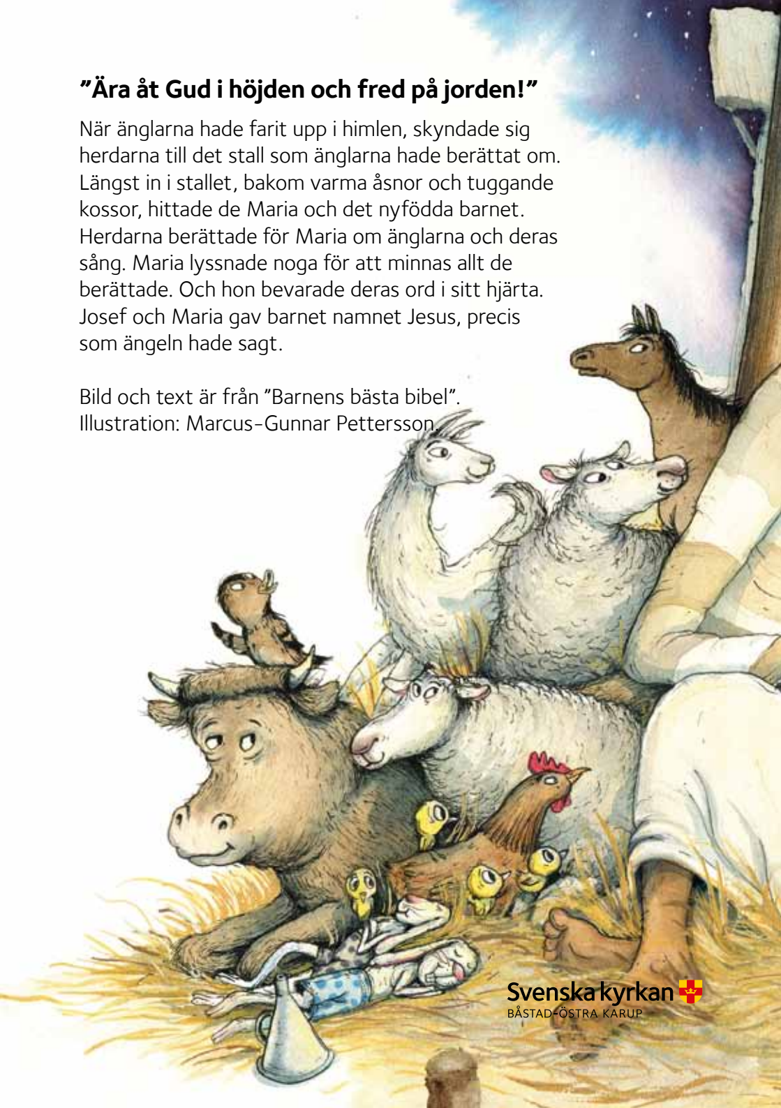
Illustration: Marcus-Gunnar Pettersson

Bild och text är från ”Barnens bästa bibel”.