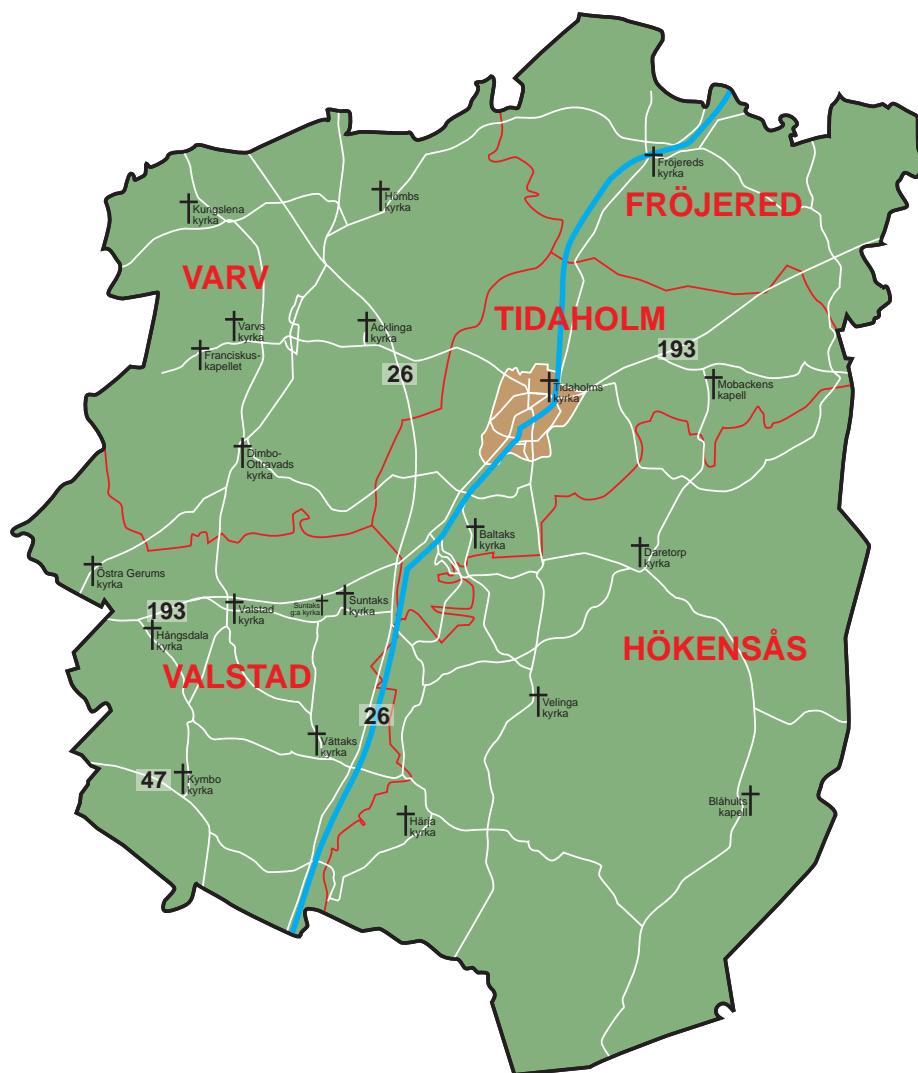
Folkmängd 1 nov 2020 - Tidaholms kommun

Svenska kyrkan Tidaholm (Tidaholms pastorat) består av fem församlingar: Tidaholm, Varv, Fröjered, Valstad och Hökensås (samma geografiska område som Tidaholms kommun) som i sin tur är indelat i tre arbetsområden. En småstad med knappt 13 000 invånare, varav ca 2 700 är barn (0-18 år). Ca 70 % är medlemmar i Svenska kyrkan. Tidaholms stad är omgiven av landsbygd.