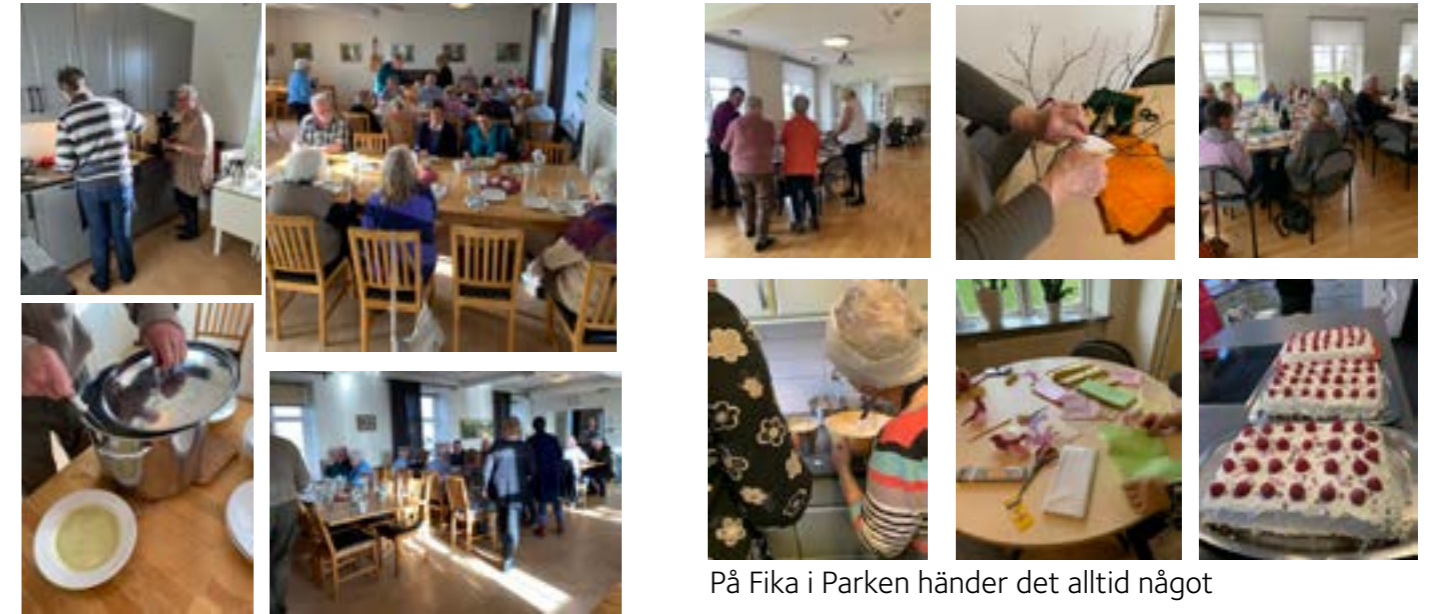
Sopplunch i Klagstorp