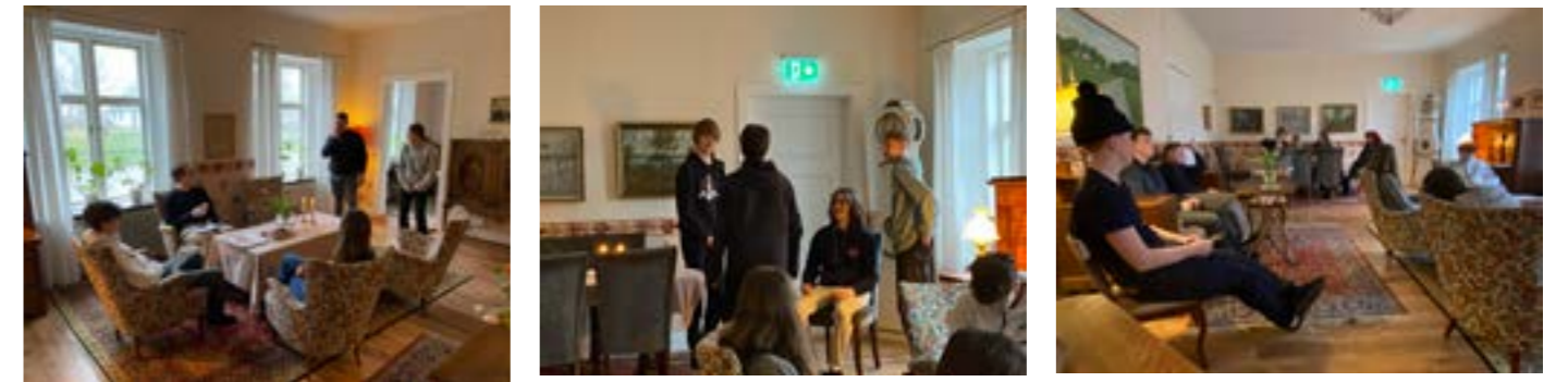
Konfirmander på Äspögården