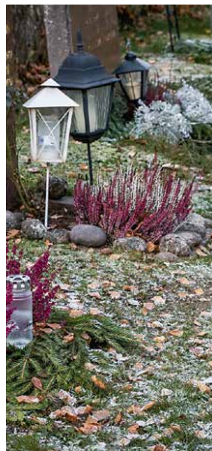
Ljung och granris på hösten och blommor på sommaren. Genom att välja skötselavtal kan du ordna så vaktmästarna håller gravens fin med blommor eller smyckning efter säsong.

Och under ett år är det en hel del som vaktmästarna sköter. Från vårens städning av kyrkogården, vår- och sommarplantering, till ogrärensning, vattning och krattning, till höstens borttagning av sommarblommorna och påfyllning av jord, fram till vintervilan. Och även om växtligheten utomhus går i vila är det full aktivitet för vaktmästarna: maskiner servas, det målas, tapetseras och sys. Alléträden ska klippas, kyrkorna städas och snön skottas. Utöver