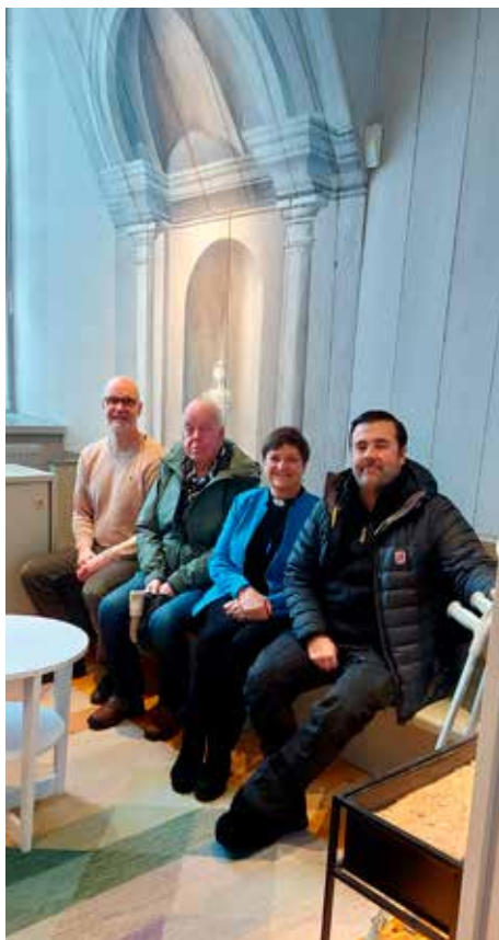
Nyrenoverat i Tuna kyrka.