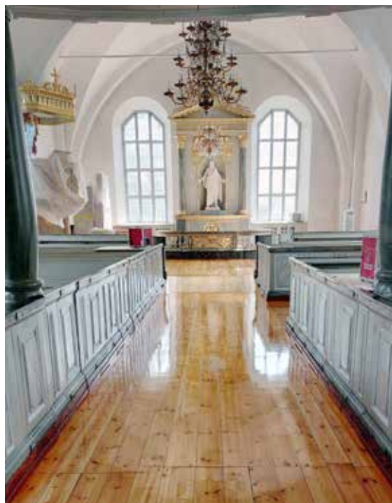
Nylackat i Tuna kyrka.