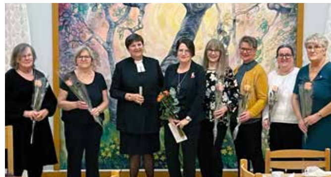
Tack i Attmars församlingsgård.

Var dag är en sällsam gåva, en skimrande möjlighet.