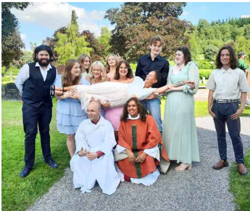
Ledarteamet för sommarkonfirmanderna 2024.