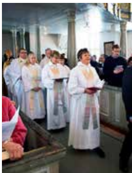
Birgits installation i Tuna kyrka 2013.