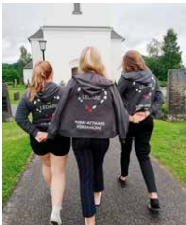
Unga ledare – "På rätt väg".