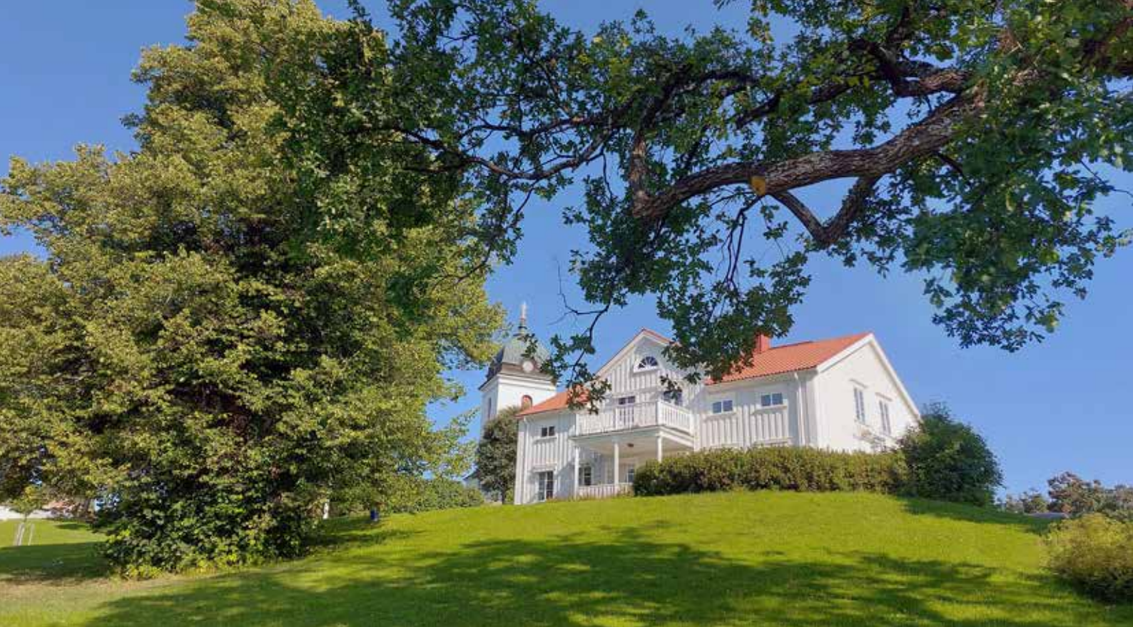
Prästgården Tuna och klocktornet.

Andan i arbetslaget har varit stöttande och samarbetet med förtroendevalda gott. Många glada skratt har också funnits i vår arbetsgemenskap. Likaså har samarbetet med kyrkvårdar och ideellt engagerade betytt mycket. Böner och förböner har burit mig och församlingens arbete.