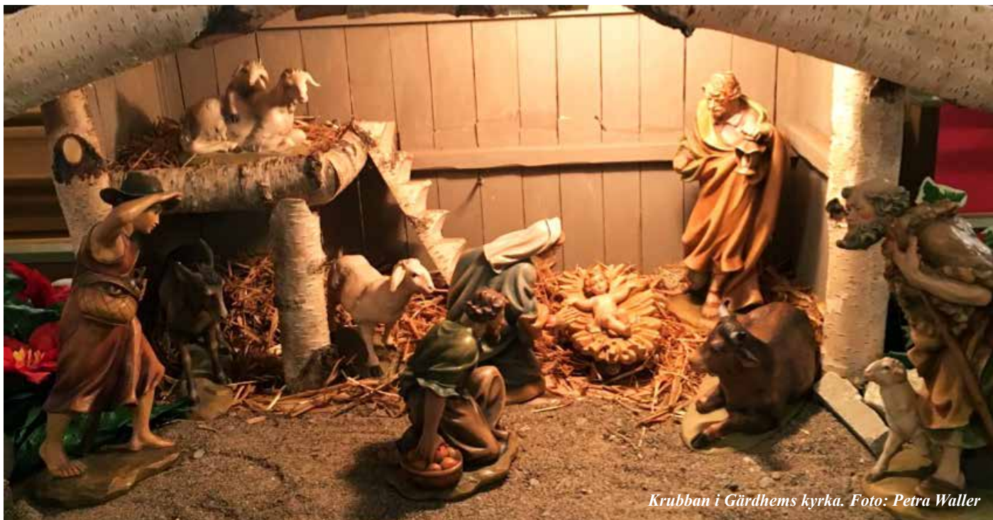
Krubban i Gärdhems kyrka.