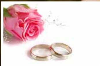
Drop in dop och vigsel