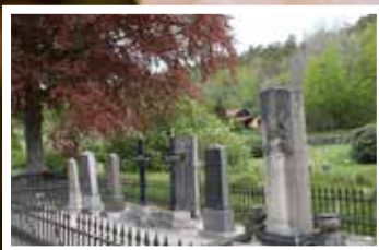
Provtryckning av gravstenar