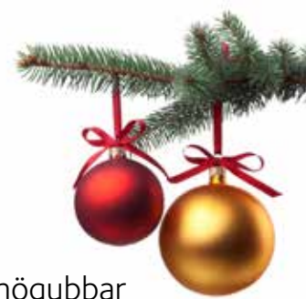
Snögubbar av toarulle

Klipp ut tre cirklar av mönstrat papper, vik cirk- larna på mitten två gånger och limma ihop dem som på bilden.