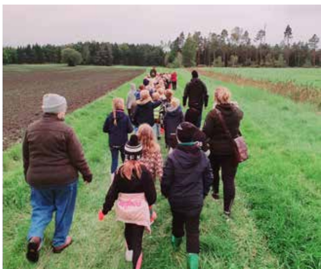
”Ska-ut gruppen” på väg ut i skogen.