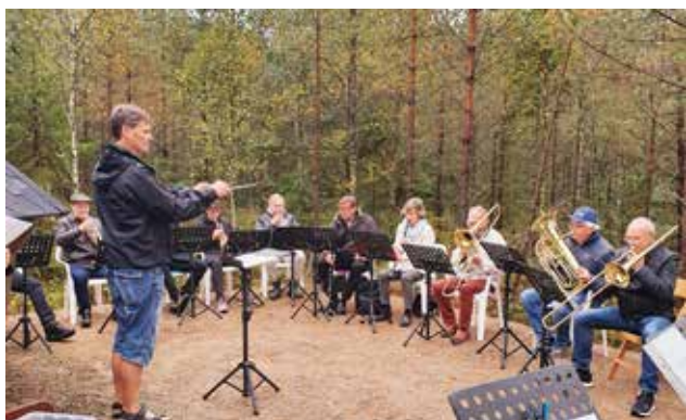
Friluftsgudstjänst vid Skogskojan i Velanda. Velandaorkstern spelade.