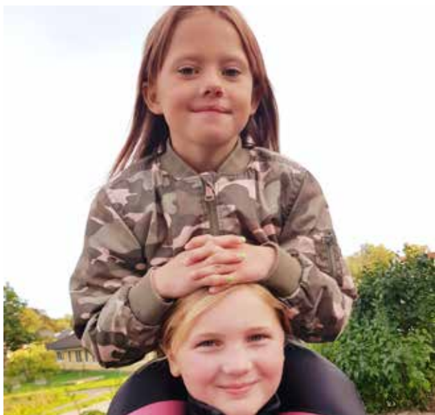
Två flickor ur ”Ska-ut-gruppen” i Velanda.