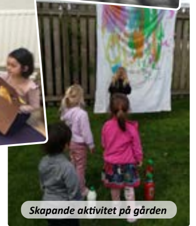
Skapande aktivitet på gården