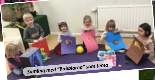
Samling med "Babblarna" som tema