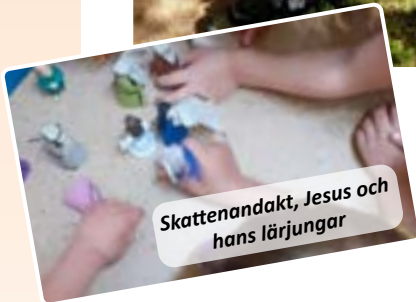
Skattenandakt, Jesus och hans lärjungar