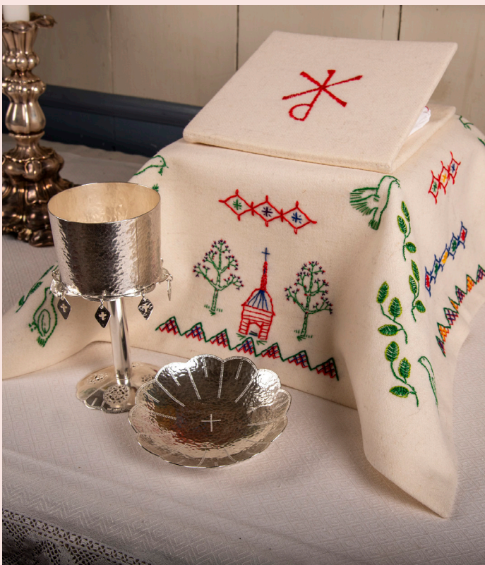
Samiskt nattvardssilver med textilier.

Kyrkans äldsta textilier är av rött ylle med broderier i silke från 1770. Den äldsta mässhaken bär årtalet 1778. Skruden är tillverkad i svart sammet med ett silverkors på baksidan och på framsidan en bröstsköld med gudsnamnet Jahve broderat med hebreiska bokstäver. Dessutom finns det mässhakar i andra liturgiska färger. Till höger i kyrkan hänger ett votivskepp i form av en forsbåt med namnet Farkosten. Forsbåtar av denna typ användes på Torne älv för att transportera passagerare över vattnet. Den 1 meter långa skulpturen är utförd av Thomas Qvarsebo 2006 och inköptes med anledning av kyrkans 400-årsjubileum. Dessa votivskepp finns i många kyrkor och de är ofta skänkta av sjömän som räddats i sjönöd.