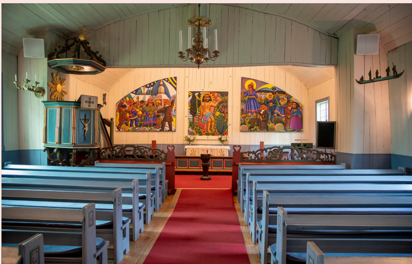
Detaljer från altartavlan av Bror Hjorth och kyrkorummet.