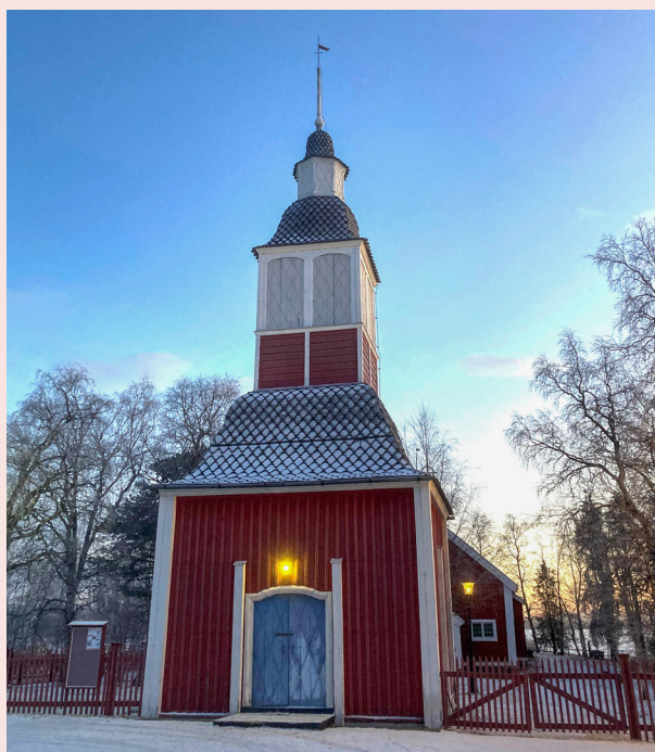
Klockstapeln vid Jukkasjärvi kyrka.