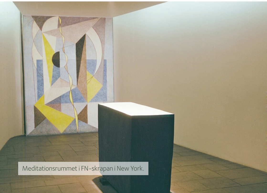
Meditationsrummet i FN-skrapan i New York.