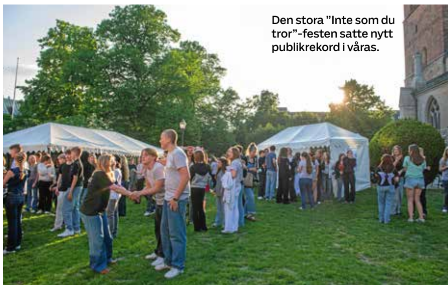
Den stora "Inte som du tror"-festen satte nytt publikrekord i våras.

➤ LÄS MER på svenskakyrkan.se/orebro/nyheter/abba-konsert-i-mikael