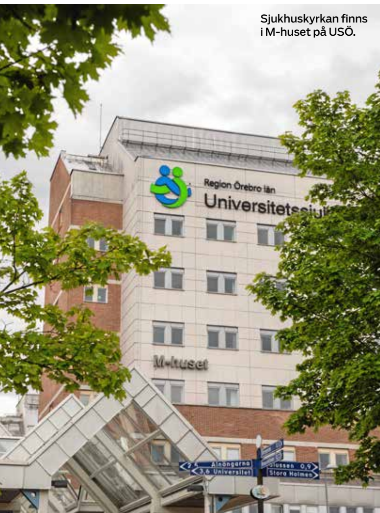
Sjukhuskyrkan finns i M-huset på USÖ.