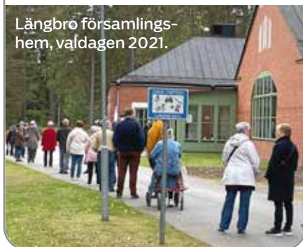
Långbro församlingshem, valdagen 2021.