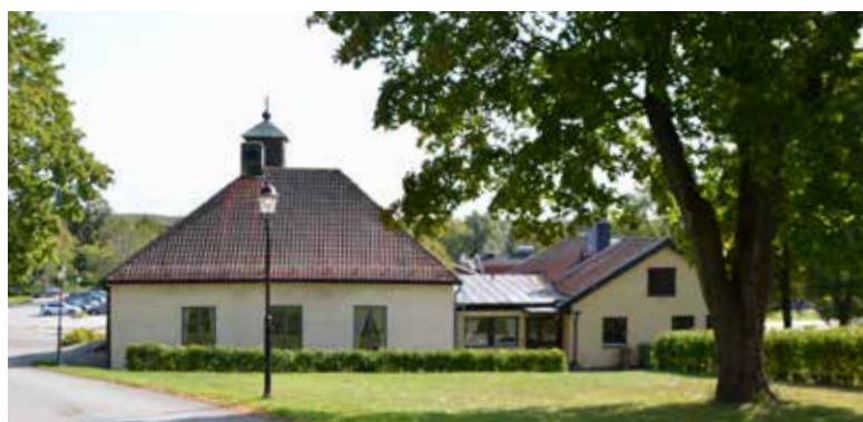
NYGAMMALT. Snart är renoveringen av Västerlövsta församlingshem så pass färdig att vi kan börja vistas i lokalerna igen.

utnyttja sådana ytor som vi inte har använt förut och att det ska ge ett trevligt, familjärt intryck.