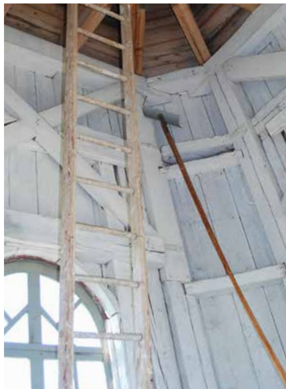
LÅNGSKAFTAD. Den långa snöskoveln har använts för att skotta snö från kyrktaket.