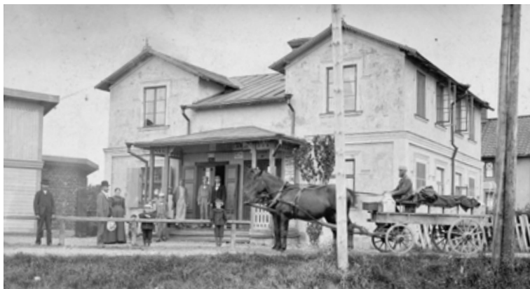
HAGMANS LIVS. Troligen den sista lanthandeln i Vittinge – en ICA-affär som blev ensam på orten när Konsum lades ned på 1960-talet. Bilden är från tidigt 1900-tal. Verandan revs senare. Mjölkkärnan kommer från Skattmansö. I fastigheten Stjernan/Stjärnan är det nu behandlingshem.

Genom Norra stambanans tillkomst, då en tågstation förlades till Näsbo-Brunnsätra, uppstod stationssamhället Vittinge. Bland de första byggnaderna att uppföras var affärshuset Stjärnan. Här inrättades den första telefonväxeln i Vittinge. Här samlades också mjölk upp från bondgårdar för vidare transport till Sala, medan smör köptes upp till beställare i Stockholm.