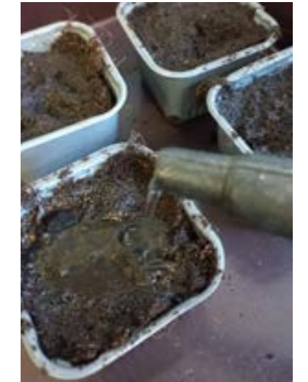
Vattna igenom jorden.