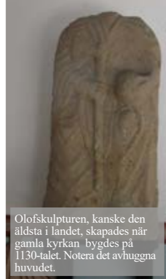
Olofskulpturen, kanske den äldsta i landet, skapades när gamla kyrkan bygdes på 1130-talet. Notera det avhuggna huvudet.

nämnda familjens betydelse, är de två stenhuvuden som sitter inmurade i nedre tornkammaren, där den ena bär en kunga- eller hertigkrona, enligt Anna Thorsson. Det andra huvudet kan beskrivas som en tandagnisslare som kanske symboliserar rädslan för döden.