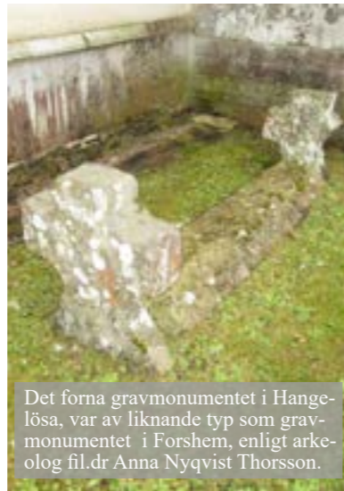
Det forna gravmonumentet i Hangelösa, var av liknande typ som gravmonumentet i Forshem, enligt arkeolog fil.dr Anna Nyqvist Thorsson.

Eller med andra ord en familj utöver det vanliga med tanke på alla inventarier från denna tid som Olofskulpturen, kanske landets äldsta, som skapades på 1130-talet, då kyrkan byggdes. Den gömdes i kyrkogårdsmuren någon gång efter 1669 för att sedan hittas någon gång före 1869, men med avhugget huvud. Till denna kommer dopfunten med sina inskriptioner som stärker forskarnas teorier att kyrkan var vigd åt Sankt Olof. Ytterligare två värdefulla inventarier, som visar den