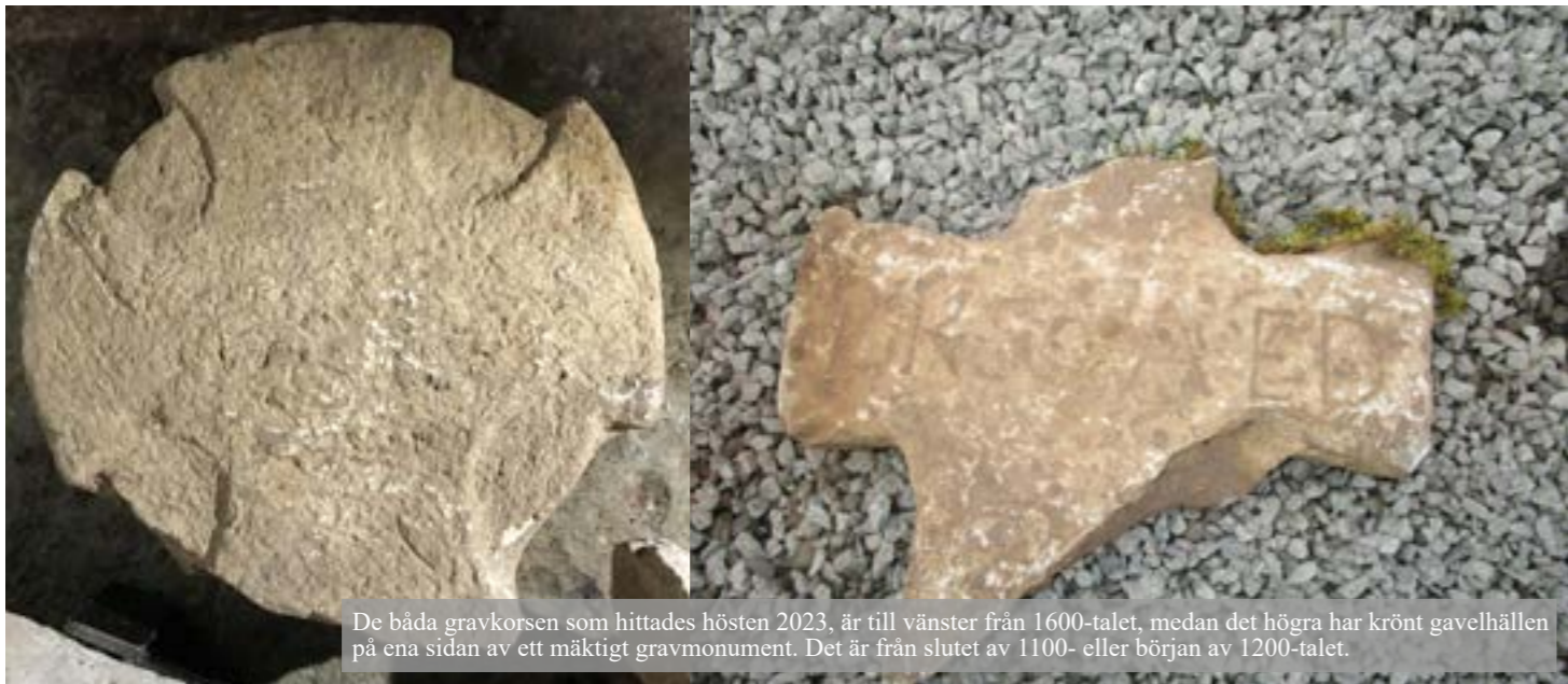
De båda gravkorsen som hittades hösten 2023, är till vänster från 1600-talet, medan det högra har krönt gavelhällen på ena sidan av ett mäktigt gravmonument. Det är från slutet av 1100- eller början av 1200-talet.