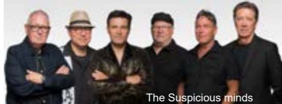
The Suspicious minds