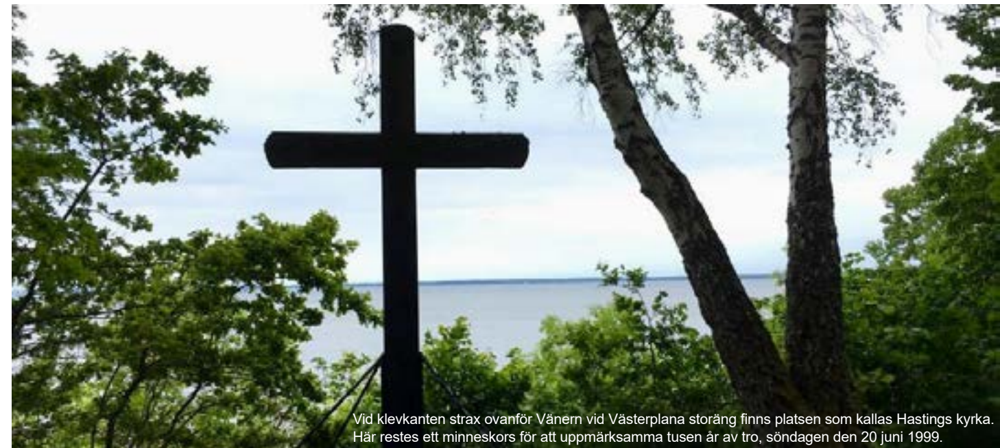
Vid klevkanten strax ovanför Väneren vid Västerplana storäng finns platsen som kallas Hastings kyrka. Här restes ett minneskors för att uppmärksamma tusen år av tro, söndagen den 20 juni 1999.

Det beror på att det var ett siktmärke som var, som jag