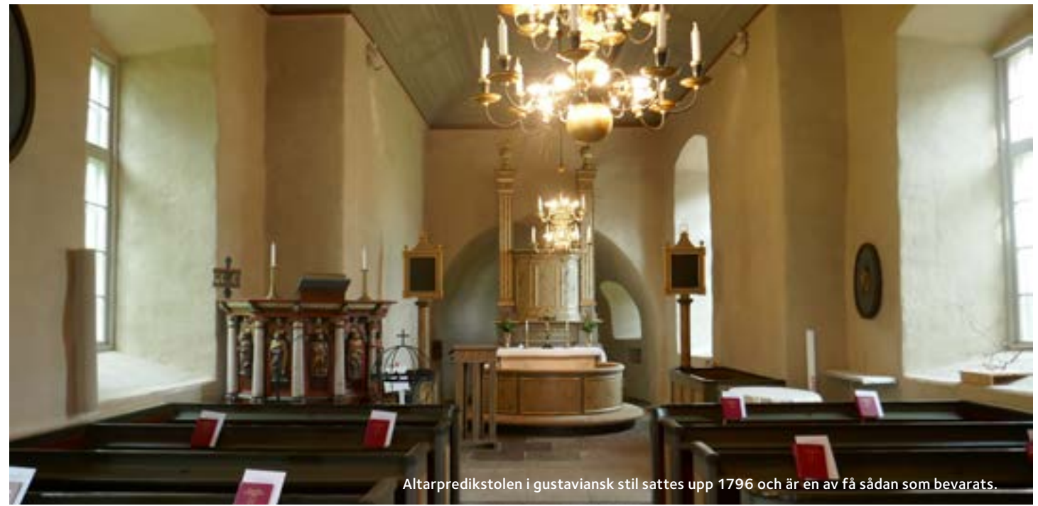
Altarpredikstolen i gustaviansk stil sattes upp 1796 och är en av få sådana som bevarats.