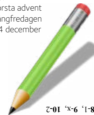
Rätt svar: 1-X, 2-1, 3-2, 4-X, 5-1, 6-2, 7-1, 8-1, 9-X, 10-2