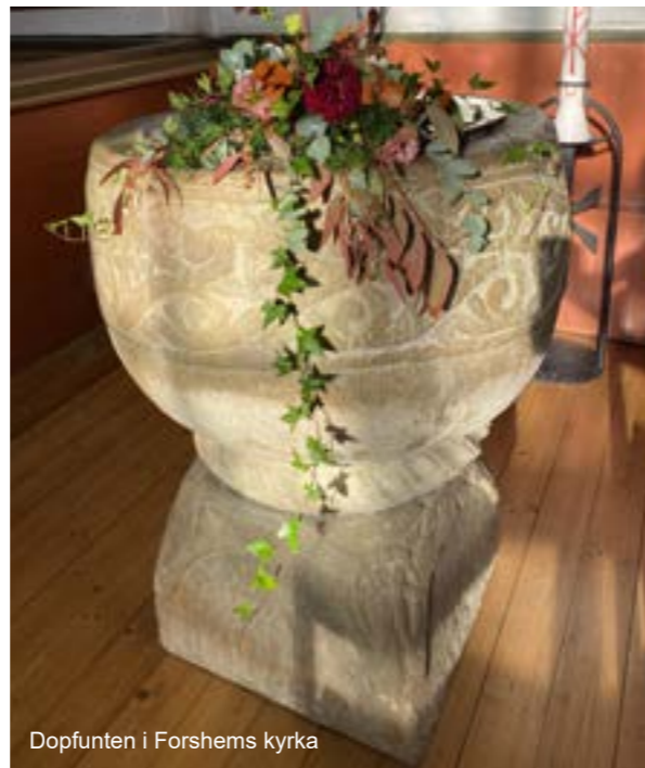
Dopfunten i Forshems kyrka