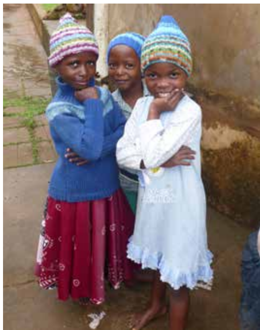
Barn som besöker gatucentret i Bukoba.