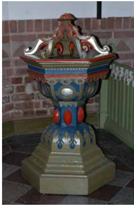
Vackert målad dopfunt i trä

eller rand, jfr skogsbryn och ögonbryn). En kyrkklocka beställdes hos J.A. Beckman & Co, Stockholm och ett orgelharmonium inköptes från C.B. Petterssons Orgelfabrik, Herrljunga.