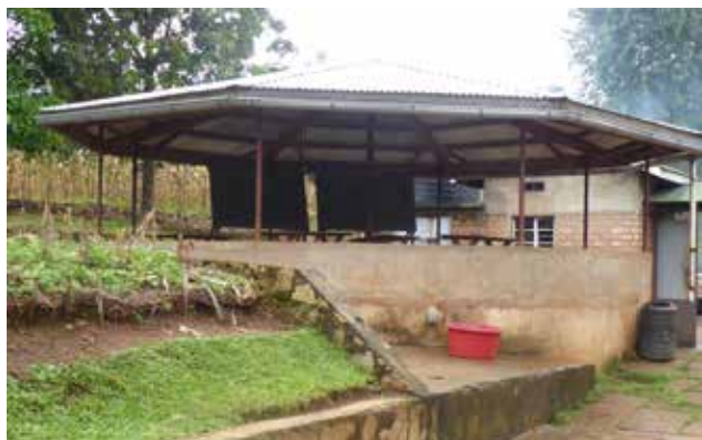
Vattentank sponsrat av Rotary i Vara. Tack var taket som byggts ovanpå vattentanken går det också att torka säd.