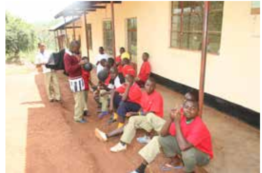
Elever vid Emau yrkesskola.