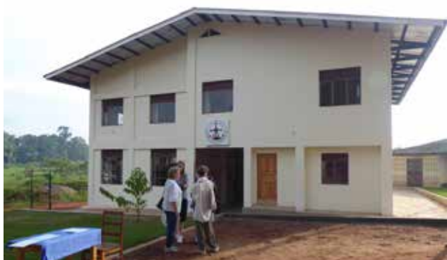
Det nybyggda mottagningscenter i Bukoba.