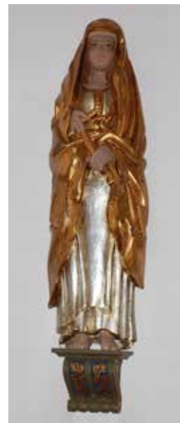
Två skulpturerade skyddshelgon, ca 130 cm höga, i silver, guld och karnationsfärg.