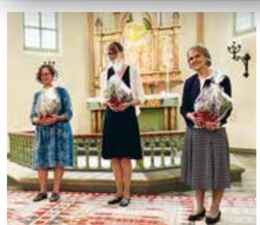
Tre medarbetare som avslutat sina tjänster avtackades.