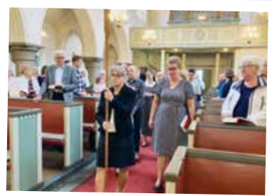
Procession inledde gudstjänsten.