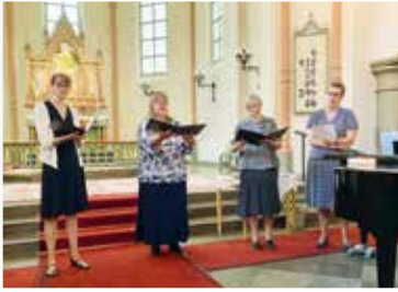
Fyra kantorer, som bildade kvartetten "Mega", bjöd på skönsång.

Sista söndagen i augusti firades pastoratsmässa i Undenäs kyrka! Coronarestriktionerna har gjort att man inte kunnat samlas på 1½ år så nu var glädjen stor att kunna mötas igen och bland annat äntligen välkomna åtta nya medarbetare.