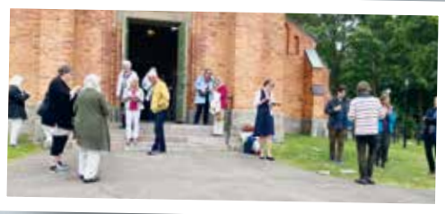
Efter gudstjänsten samlades man för kyrkkaffe och mingel.