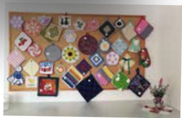
Sommarkyrka i Udenäs - utställning av grytlappar.