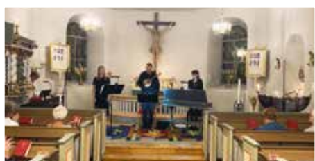
Musik i sommarkväll i Brevik. "Från Venedig till Wien", Camerata Mandolino Classico.