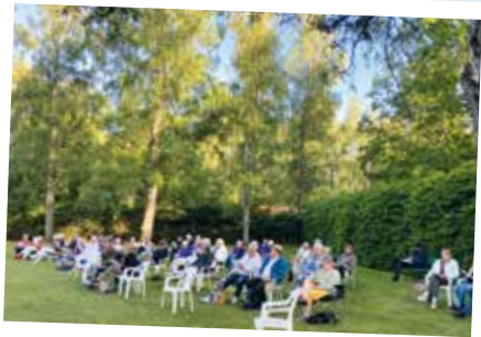
Visafton vid Bocksjö kapell.