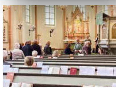
Nattvardsfirande med sk obrutet duklag.