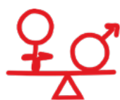
Jämställdhet och hälsa