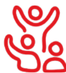
Fred och demokrati