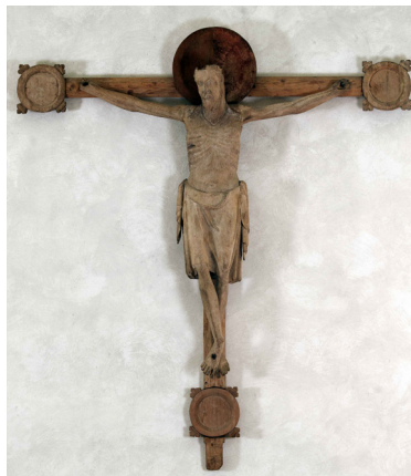
Krucifixet från 1200-talet finns i Björnlunda kyrka

Många vuxna minns säkert barndomens långfredagar. Då var allt stängt och det fanns inget att göra. Radion spelade bara tung musik och ingen fick gå ut och leka. Hela samhället fick då inrätta sig efter att det var en sorgens och mörkrets dag vare sig man var troende eller inte.