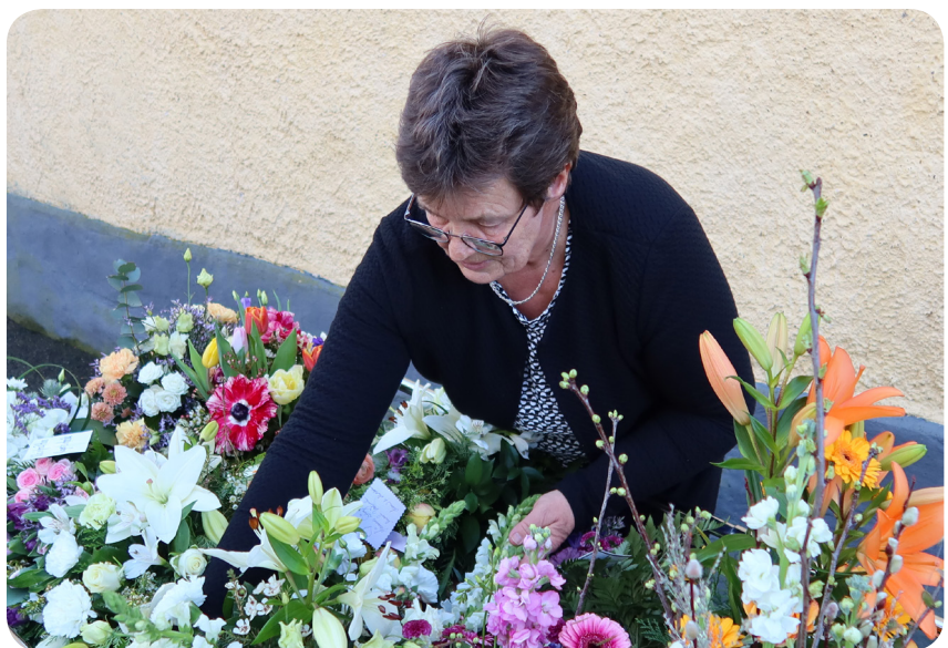
Efter en begravning läggs blommorna ut på graven där den avlidne ska ha sin sista vila.

- Kyrkogården har alltid varit mycket välkött och jag har under årens lopp fått många uppskattande ord för att det är så vackert att besöka