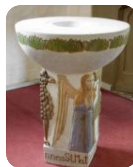
Dopfunten i Gryts kyrka

Dopfunten i Gryts kyrka är av gotländsk sandsten tillverkad 1982. Hög kvadratisk fot med dekor av målade reliefer av de fyra evangelistsymbolerna och runt fotlisten står deras namn. Kuppen är halvfärisk och har upptill en urgröpfung som passar till dopskålen av mässing från 1915. Runt kuppen löper en bård av näckrosor, ett repetitivt mönster av landstingets symbol.