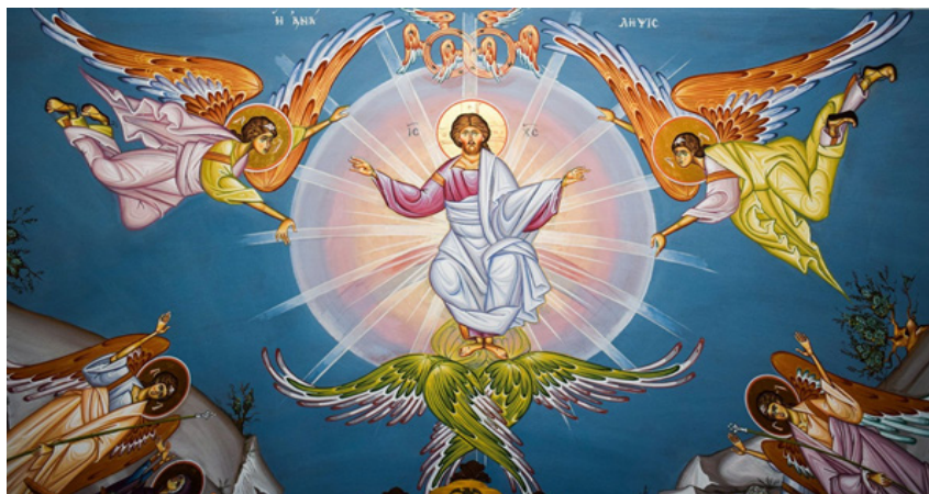
Bilden är från Lagunda församling i Uppland. Ur Markusevangeliet: När herren Jesus hade talat till dem blev han upptagen till himlen och satte sig på Guds högra sida.