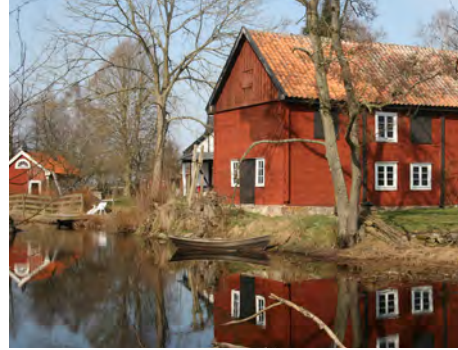
Garveriet vid Holmskvarn

Ett vanligt och tidigt brukat sätt att färdas var till sjöss. Betydligt mer komplicerat var att ta sig fram på land, vilket vanligen skedde till fots eller ridande. Färdvägarna följde ofta kuster och vattendrag och löpte även på åsarna. Särskilt besvärligt var det att ta sig fram i inlandet med dess vida skogar och kuperade terräng.