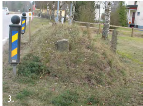
Bild 3. Femstenarör i Tvärskog. Gränsröse för fyra byar.