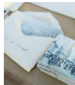
■ Allmänna gruppen hjälper till med många olika saker. Andra tisdagen i varje månad serverar de sopplunch i församlingshemmet. Kuvertering är en annan uppgift som Allmänna gruppen också har ansvar för.