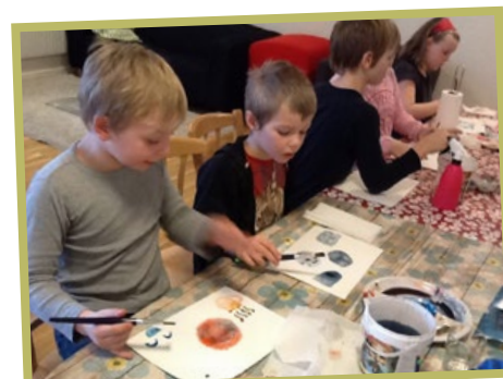
Akvarellmålning på fritidshemmet. Under juni månad kommer Stjärnan att ha en utställning på Biblioteket, välkomna att se på vår alster.