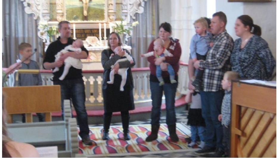
Ängloutdelning Västra Torup.