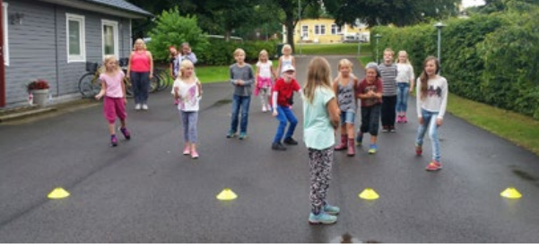
Barn från Sommarkyrkan 2015, foto: Sofia Thörn

Årets Sommarkyrka för barn går av stapeln tisdag till fredag i vecka 33. Är du född 2005-2008 så kommer du att få en inbjudan i vecka 23 hem i din brevlåda. Undrar du något redan nu så maila till barnsvenskakyrkantyringe@gmail.com