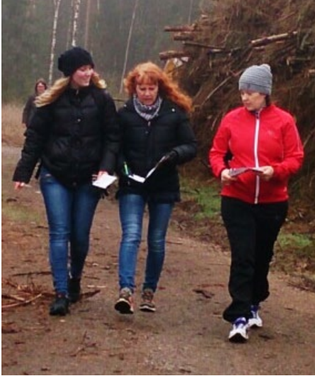
Livsloppet avslutade fasteinsamlingen i Röke.