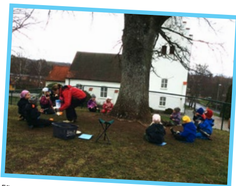
Eftersom vi tillbringar mycket tid ute har det blivit en del av vår vardag att i största möjliga mån äta vårt mellanmål ute!