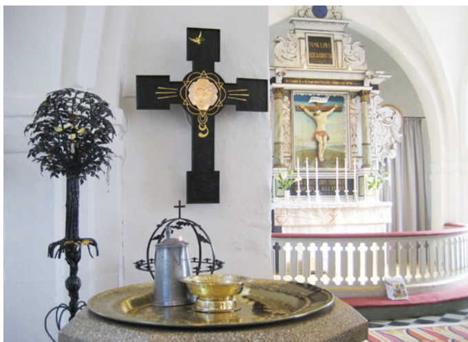
I år går det bl.a. att se det nya dopträdet som invigdes i mars.