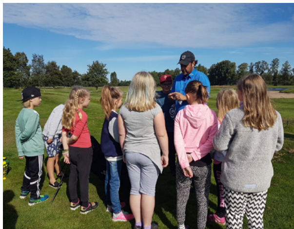
Barn från Sommarkyrkan 2016.

Årets Sommarkyrka för barn går av stapeln måndag till torsdag i vecka 25. Är du född 2005-2009 och är medlem i Svenska kyrkan kommer du att få en inbjudan i vecka 21 hem i din brevlåda. Undrar du något så maila till barnsvenskakyrkantyringe@gmail.com