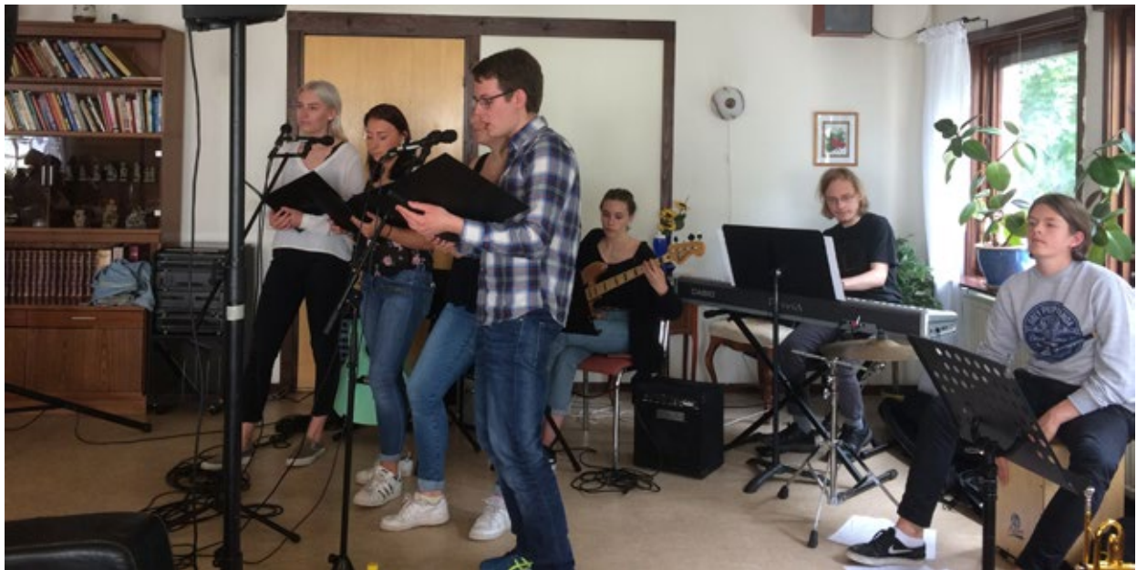
Här spelar och sjunger de på Björklunda.