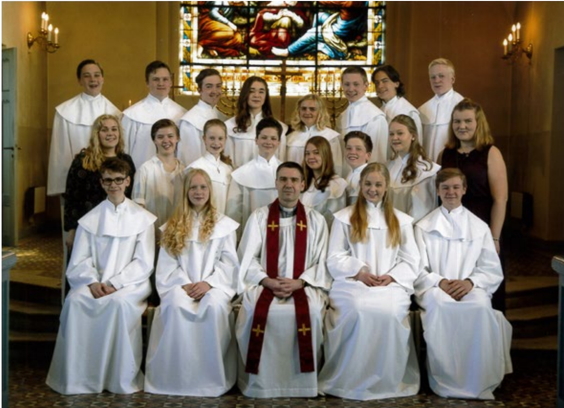
Grupp två.