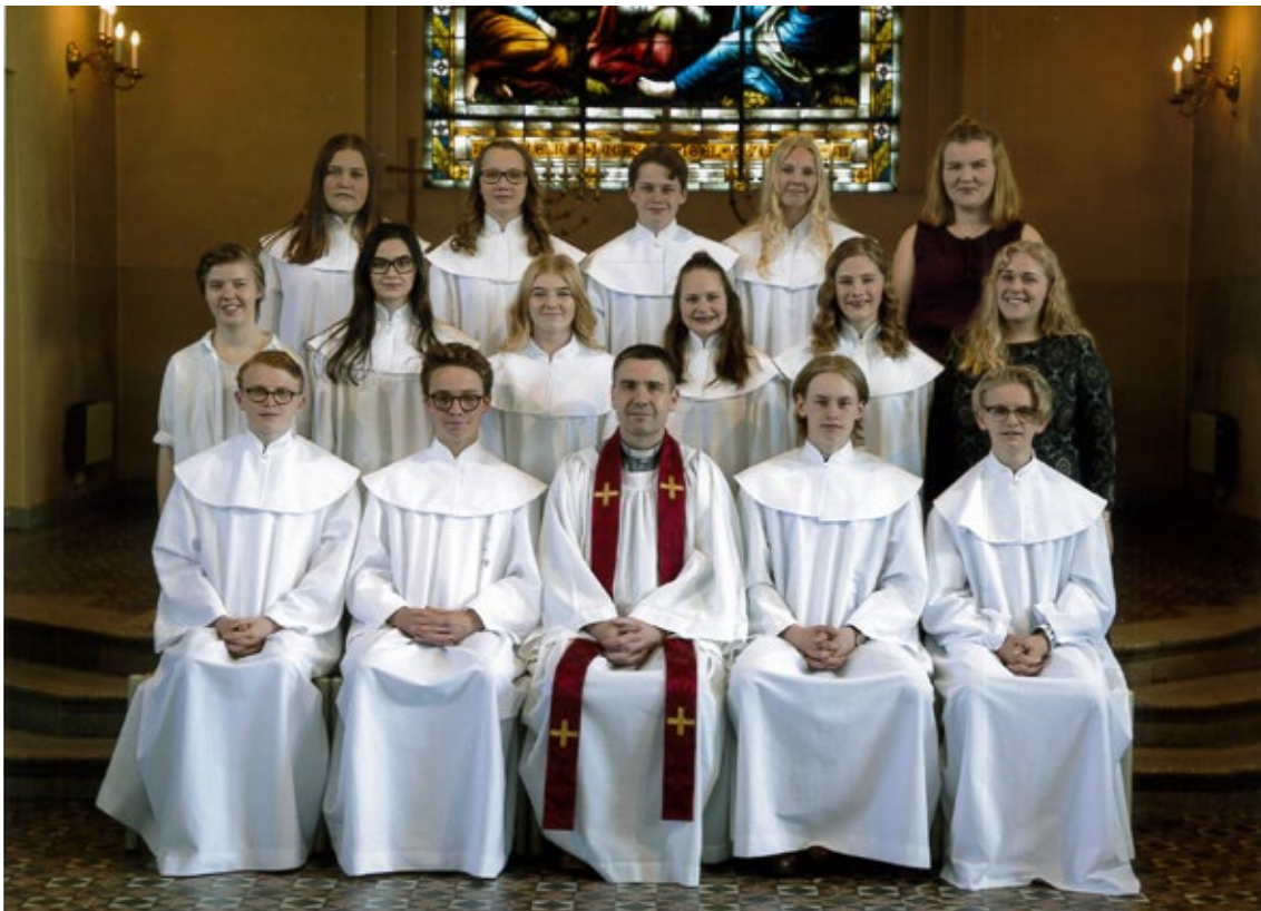
Grupp ett.