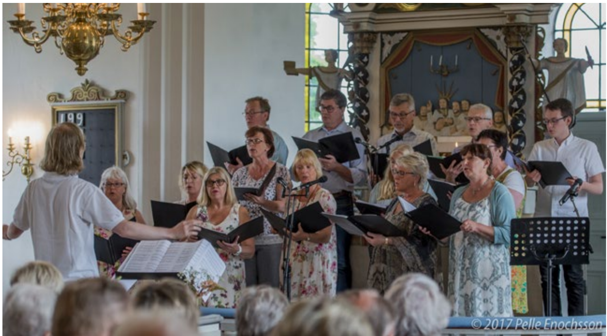
"Juniafton" Sommarkonsert Matteröds kyrkokör.

De fick även medverka söndagen 2 juli under Hörja vägkyrka med musik i gudstjänsten och i församlingshemmet. Vilket blev ett härligt avslut på en lyckad vecka!