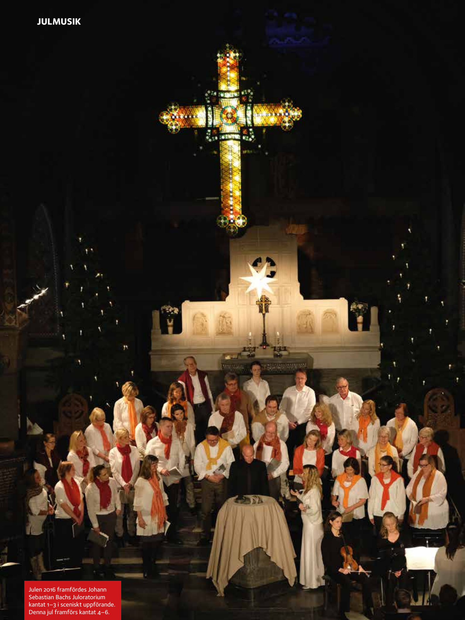
Julen 2016 framfördes Johann Sebastian Bachs Juloratorium kantat 1–3 i sceniskt uppförande. Denna jul framförs kantat 4–6.