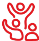
Fred och demokrati