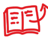
Tro och lärande