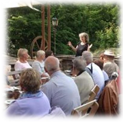
Fler bilder från församlingsutflykten den 15 juni