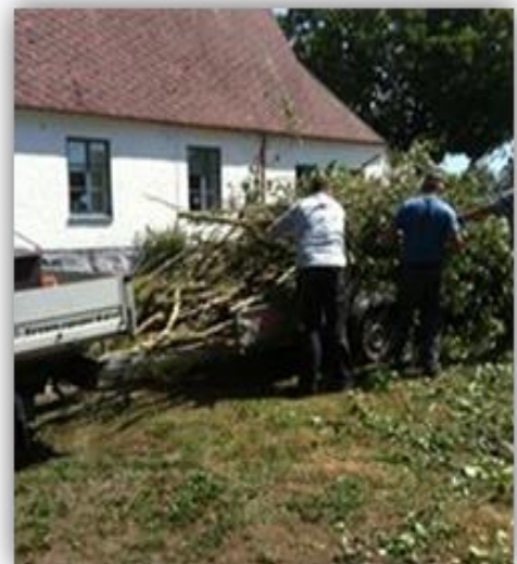
Trädgårdsarbete och röjning i Kverrestad bygdegårdspark

Församlings salen i Smedstorp som rymmer c:a 50 Personer. Boka på telefon 0414-51118, vardagar 9-12.00