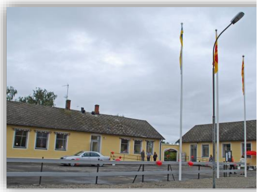
Bilder från invigningen av Församlingsgården och bonad i Församlingsalen