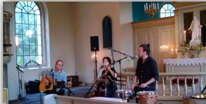
Musik i sommarkväll med JP-Trio i Kverrestads kyrka