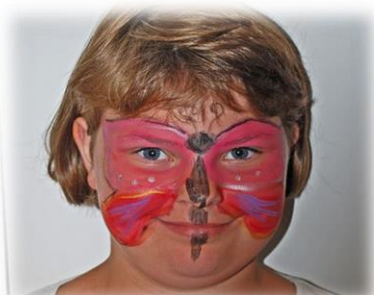
Barnen blev fina vid ansiktsmålningen