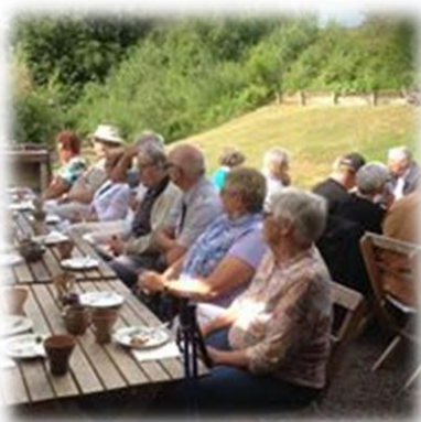
Bilder från församlingsutflykten den 15 juni, som i år bestod av båtfärd på Rönneå, lunch på hamnkrogen i Skälderviken och besök på Vallåkra stenkärlsfabrik