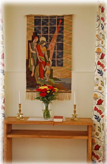
Altaret i nya Församlingssalen i Församlingsgården Smedstorp