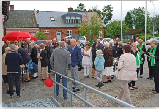
Mingel innan gudstjänsten med äppelmust från Tosterup