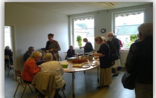
Även kaffe och bakelse serverades