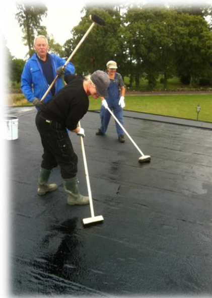
Klippning av buxbomshäckar i Bollerup och tjärning av tak på Smedjan i Kverrestad