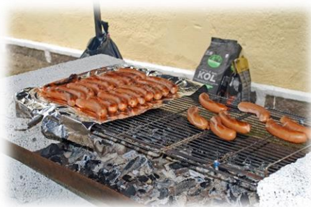
Det bjöds på korv från Ingelsta kalkon efter gudstjänsten