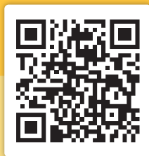
Sjukhuskyrkan i Norrköping

Scanna QR-koderna för att läsa mer om Sjukhuskyrkan och om Sjukhuskyrkan i Norrköping.