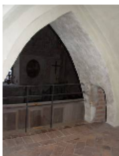
Framför gapskullen var en läktare utbyggd fram till 1763. Därefter var Gapskullens valvöppning förbyggd fram till 1917.