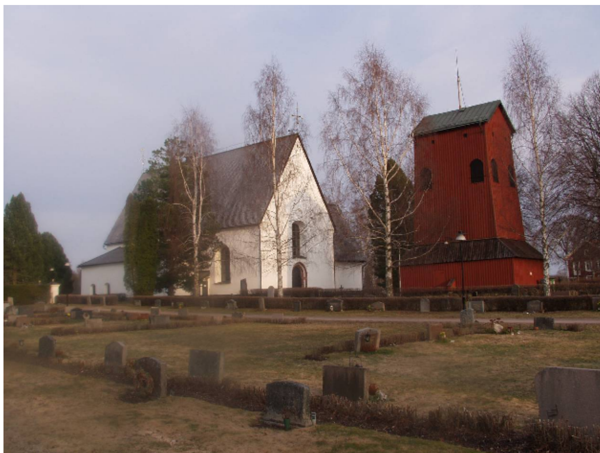
Vika kyrka, med kyrkogårdens norra kvarter i förgrunden

Bygden runt Vika tillhör Dalarnas tidigast koloniserade och mest betydande under järnålder och medeltid. Landskapet är mycket varierat, med sina vattendrag, skogar och öppna odlingsmarker. Den historiska bebyggelsen ligger samlad i klung- och radbyar, ofta i nära kontakt med fornlämningsområden. Sockenkyrkan ligger på en ås som skiljer Vikasjön från den mer vidsträckta sjön Runn. Intill finns en liten centrumbildning och ca 200 meter söderut ligger prästgården, med huvudbyggnad uppförd 1863. Området har klassats som riksintresse för kulturminnesvården.