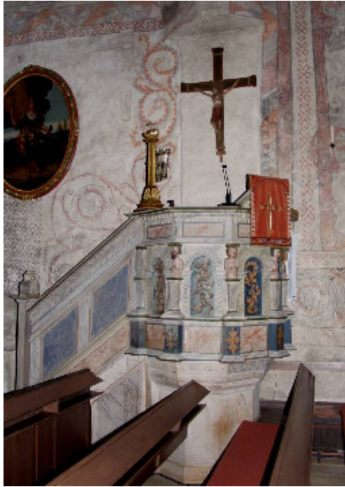
Predikstolen från mitten av 1600-talet tillhörde ursprungligen Vadstena hospitals kyrka. Den överfördes till Vika 1918 – Digitalfoto Sven-Erik Nylander

Vid södra väggen är predikstolen infäst, med korg från mitten av 1600-talet, marmorerad i grått med ornament i gult mot blå botten i fyllningarna, uppläggningar i grönt och andra färger i listerna.