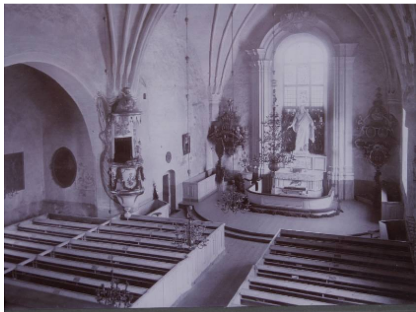
Kyrkorummet fotograferat omkring sekelskiftet 1900, då altaret dominerades av en Kristusskulptur, ställd på tre tavlor i relief, dels en replik av Leonardo da Vincis ”Kristus instiftar nattvarden” dels symboler för evangelium och lagen. Dåvarande predikstolen i barockstil hade tillverkats 1774-76 av snickarmästare Holmgren. Valv, väggar och inredningssnickerier var i huvudsak vita

Vid en reparation 1825 insattes södra sidans fönster med spröjsverk av trä – däremot behölls norra och östra sidans fönster med blyinfattade rutor. Ny bänkinredning byggdes 1852 av snickaren Göran Jansson från Torsång, fast delar av 1600-talets bänkar sparades och återanvändes. 1891 ersattes det murade altaret av ett enklare, utfört i trä. På detta ställdes en gipsreplik av danske skulptören Thorvaldsens kända Kristusskulptur. Dessutom uppsattes tre tavlor i relief. En orgel i nygotik installerades 1900, medan den tidigare från 1769 såldes.