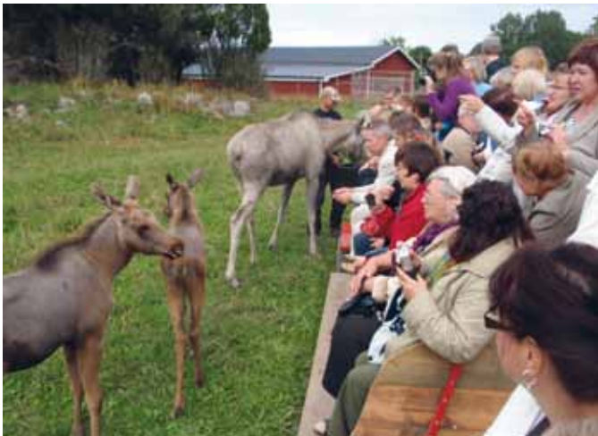
Älgarna på Gårdsjö älgpark poserar gärna inför förtjusta åskådare.