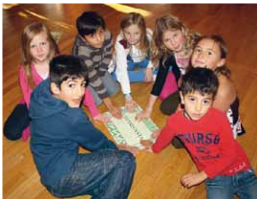
Några av sångfåglarna summerar dagen

” Jag tyckte det var en rolig dag. Kul att få lära sig nya sånger och att få uppträda med så många körer. Det var lite svårt att lära sig så många sånger på bara några timmar med det gick bra ändå.