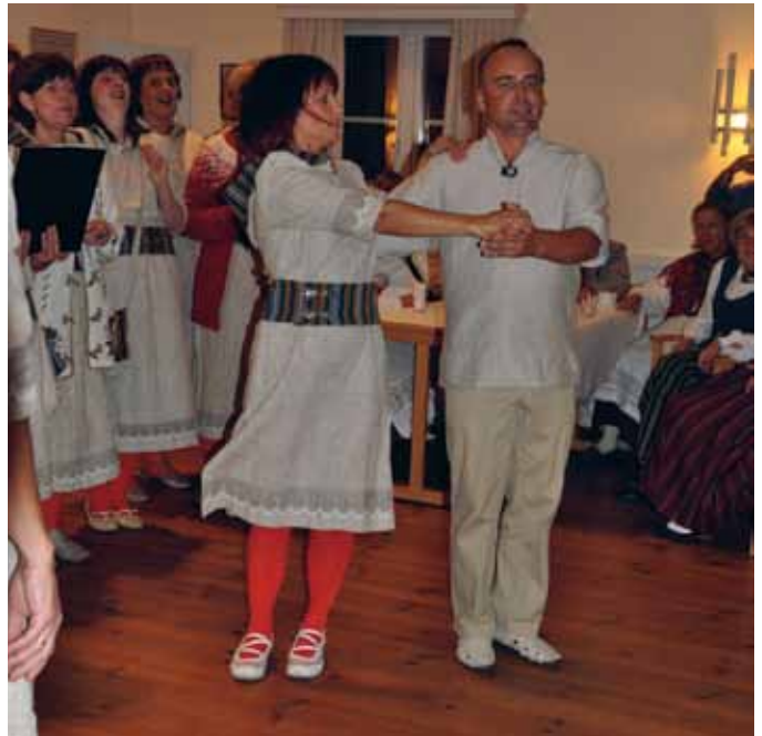
Sällskapsdans och sång i Sala sockenstuga.

Estland har väldigt starka traditioner, starkast i Europa, kanske starkast i hela världen. Sångarna är säkra och duktiga, dirigenterna mycket skickliga. Att få vara med och se och höra och delta känns som en stor gåva.