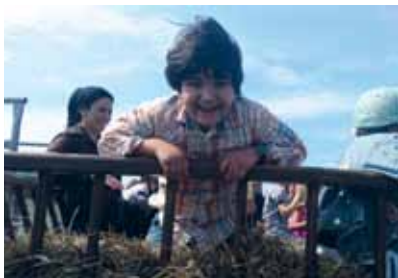
Helvar i hövagnen.

Sommarens familjeresan gick i år till Uppsala där vi först besökte Disagården, Upplands friluftsmuseum beläget i Gamla Uppsala. Där blev vi guidade runt i de många olika byggnaderna och fick