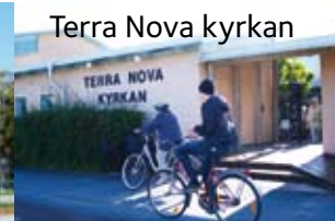
Terra Nova kyrkan