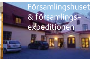
Församlingshuset & församlings- expeditionen

Visby domkyrkoförsamling erbjuder olika mötesplatser runt om i Visby. Förutom den stora medeltida katedralen mitt i stan, Visby S:t Maria domkyrka, finns tre distriktskyrkor; Terra Nova kyrkan, där vi är samarbetskyrka med EFS, fanns på plats 1983 när stadsdelen Terra Nova började byggas ut. Visborgs kyrkan, kyrkan på söder med sitt ljusa kyrkorum och församlingsdel väl anpassad för olika slags barn- och vuxenverksamhet. Och Tjelvar kyrkan, där vi är sambo med Visby missionsförsamling sedan vintern 2010. Dessutom finns på Visby lasarett ett andaktsrum där det varje vecka firas gudstjänst. I Sjukhuskyrkan arbetar Svenska kyrkan och frikyrkorna tillsammans med den andliga vården.