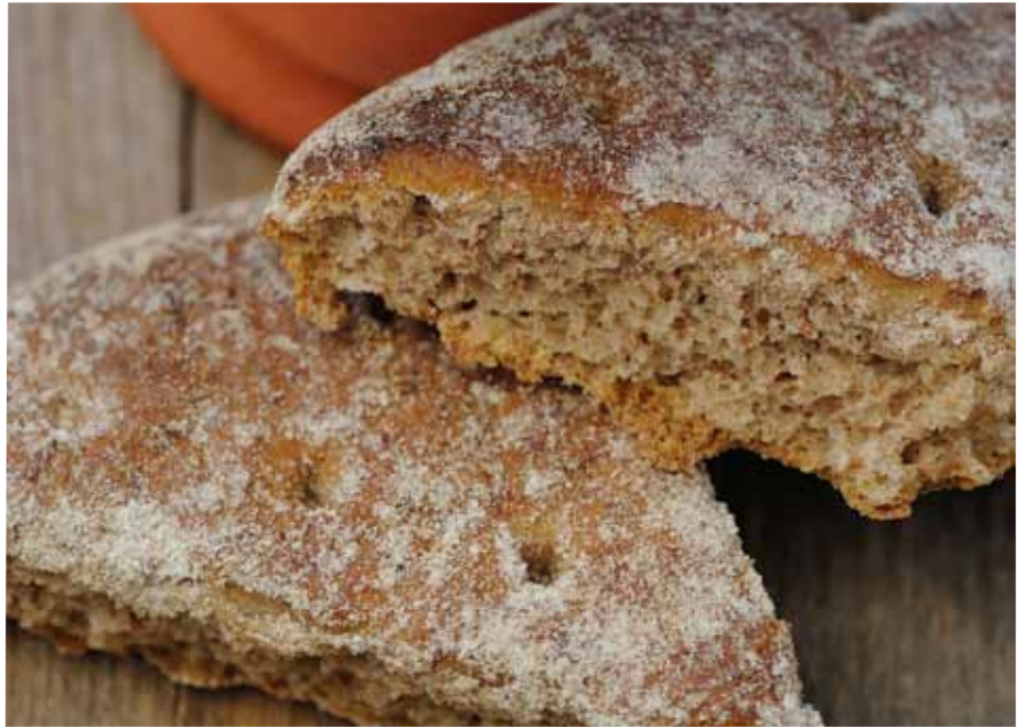
Nattvardsbrödet som vi bryter handlar om gemenskap.

och kalken som delas, alltså den gemenskap vi har i nattvardens under. När jag tänker på den så ser jag en bröddeg framför mig. Ja, jag kan riktigt känna hur den jäser under mina händer och blir större och större. Den degen förmedlar liv och växtkraft och blir till sist väldoftande bröd som ger mat, näring och gemenskap. Jag kommer också att tänka på brödundret, det som sker när Jesus får några få bröd att räcka till flera tusen människor. Detta under säger oss att vi ska dela på jordens resurser så att alla får det som de behöver. Det är då vi lever i Guds välsignelse. Nattvardsvinet handlar om livsglädje och om fest, en himmelsk måltid som vi alla är inbjudna till och delaktiga i. Denna fest kan börja redan här och nu genom att vi öppnar hjärtas dörr för varandra. Då få vi del av livets under och blir inneslutna i en större gemenskap där ingen enda är utesluten. Så må väl kära församlingsbor, den gudomliga kärleken andas igenom er.