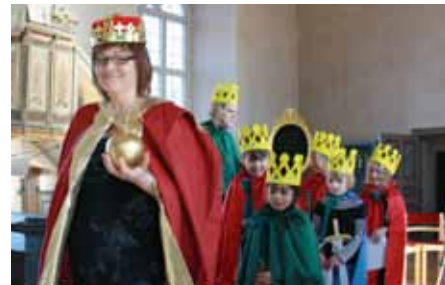
Den 2 mars kröntes Drottningen sina prinsessor i Huddunge.

Det är ett material som är framtaget av Västerås stift där vi pratar med barnen om deras inre skönhet, hur vi kan använda makt och om mod. Det gör vi genom att leka, diskutera och dramatisera som på sagornas och lägereldarnas tid.