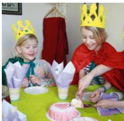
Kröningar firas såklart med prinsessårta.

Succe för prinsesskolan! Barnen får lära sig om inre skönhet, makt och mod. Första kullen prinsessor har redan krönts, nästa kröning är den 13 maj i Västerlövsta kyrka. Det var många som ville vara med, ni som inte fick plats i vårens omgång är välkomna till hösten, då kör vi igen!