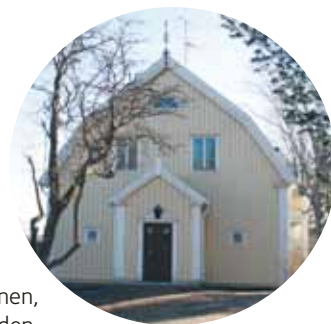
Ingången till nya expeditionen, gaveln på prästgården.

På vår hemsida www.svenskakyrkan.se/vasterlovsta kan du se många, många fler bilder och följa arbetet uppe i prästgården. Du kan även se fram emot en pampig invigning senare i höst!