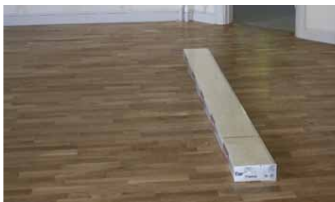
Golvet är på plats! I de rum där nya golv har behövs läggas, blir det parkett i matt ek. Hela 6 ton flytspackel har använts för att först jämna till de gamla, lite ojämna golven. Här är en bild från blivande expeditionen.