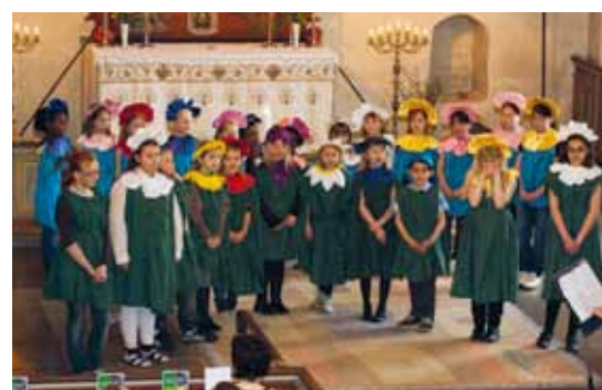
Barnkörerna Sångfåglarna i Västerlövsta och Enköpings församlingar sjöng vid en musikfamiljegudstjänst i Västerlövsta kyrka i slutet av april.