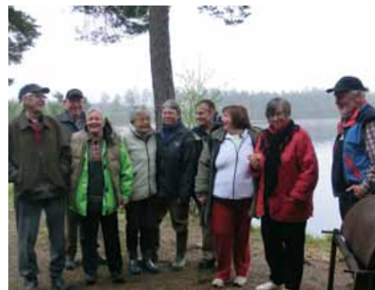
Gökotta firades av ett glatt gäng vid Dysjön i Huddunge en tidig Kristi Himmelsfärds morgon.